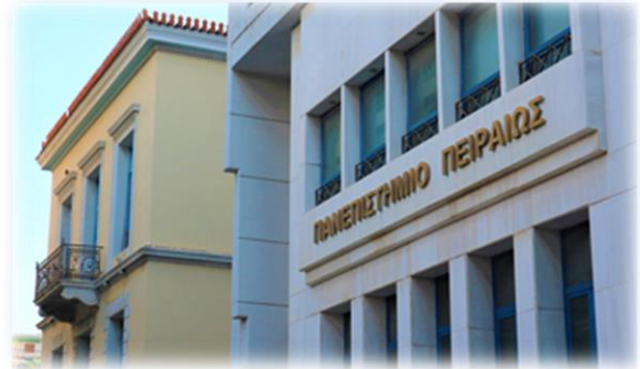
Πανεπιστήμιο Πειραιώς - Κτίριο Βιομηχανικής Διοίκησης & Τεχνολογίας