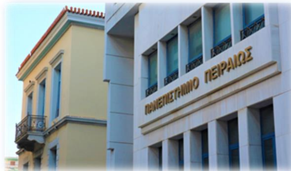
Πανεπιστήμιο Πειραιώς - Κτίριο Βιομηχανικής Διοίκησης & Τεχνολογίας